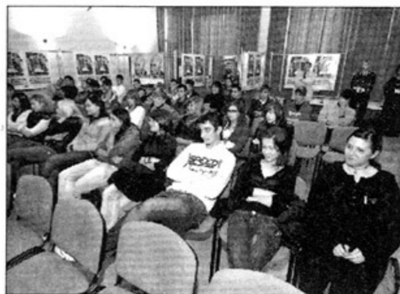
Una prova simulata svoltasi presso la Fattoria e gli studenti intervenuti all'inaugurazione della mostra

hanno preso parte alla mattina sono stati sei, l'itis Viola, i licei Celio e Roccati, l'istituto De Amicis, l'Ipsia e l'Enaip, ognuno dei quali aveva un'ora di tempo per parlare con gli esperti, vedere alcuni filmati che parlavano delle cause principali di incidenti e di quali so-